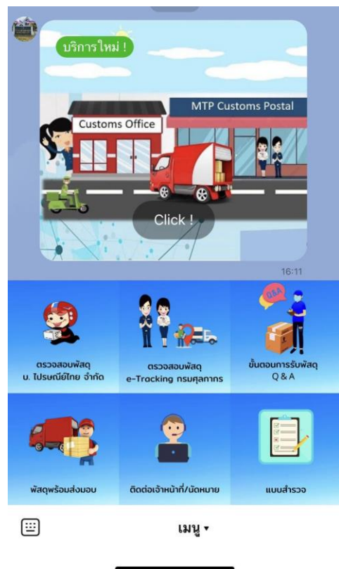
ภาพตัวอย่างหน้าจอการให้บริการผ่านระบบ LINE

สำนักงานศุลกากรมาบตาพุดเปิดให้ใช้งานระบบ “การบริการตรวจสอบและนัดหมายรับพัสดุไปรษณีย์ระหว่างประเทศล่วงหน้า ผ่านระบบ Application Line” ในชื่อ MTP Customs Postal ตั้งแต่เดือนพฤษภาคม 2564 - ปัจจุบัน